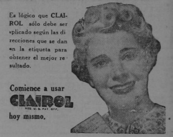
"PANATRA", Ltda. Distribuidora. Teléfono 4825

Es tan natural que aun un experto encontrará muy difícil reconocer el pelo teñido del natural y su glorioso resultado se debe a su calidad y al gran número de tonos que ofrece.